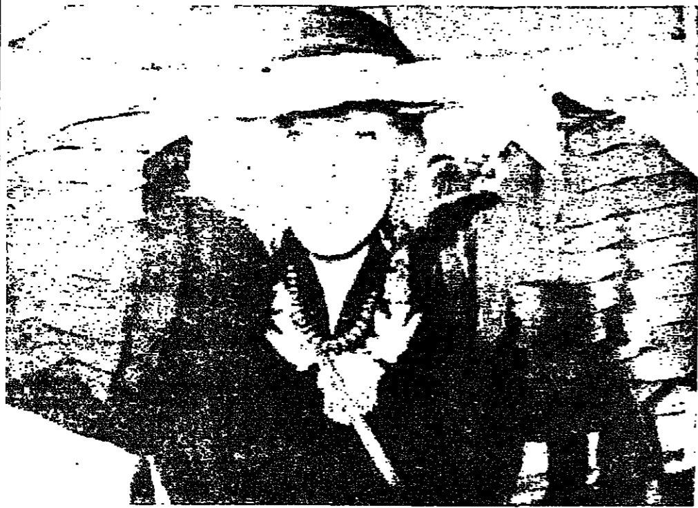
جوني ميتشل، المرشحة لنيل جائزة غرامي، المركز الذي كانت تقام فيه حفلة تقديم الجوائز في لوس أنجلوس - ر